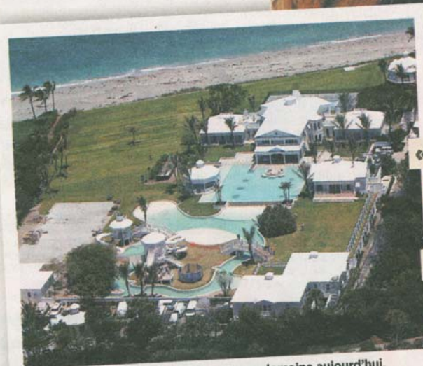
■ Le couple déménage dans son nouveau domaine aujourd'hui, à Jupiter Island en Floride.